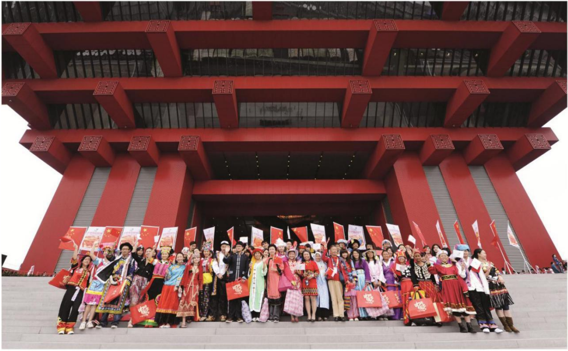
中国五十六个民族