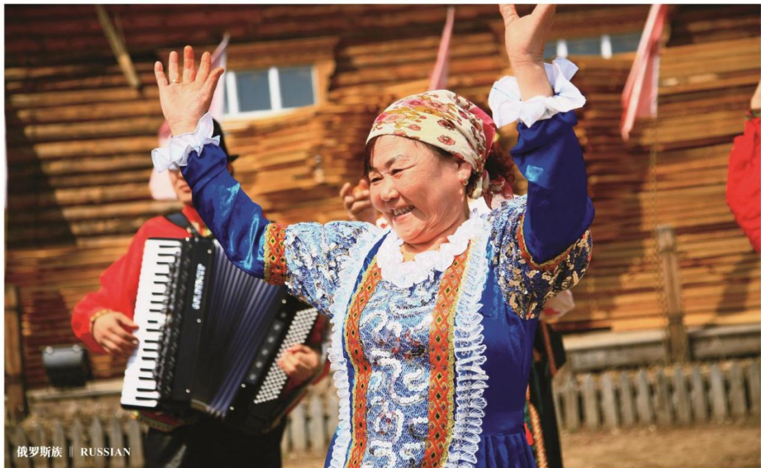
俄罗斯族 || RUSSIAN

中国的俄罗斯族主要居住在新疆及内蒙古地区，传统信仰为东正教。中国的俄罗斯族是古代俄罗斯移民的后裔，经百年的文化交融，渐渐形成自己的民族特色，拥有风格独特的民族工艺和历史悠久的民间文学。其传统服饰男子多穿斜领麻布衬衫和呢子上衣，系腰带，下穿细腿长裤、长筒皮靴；妇女多穿领口带褶的粗麻布衬衫，外罩无袖长袍“萨拉凡”，或穿自织的毛织裙。