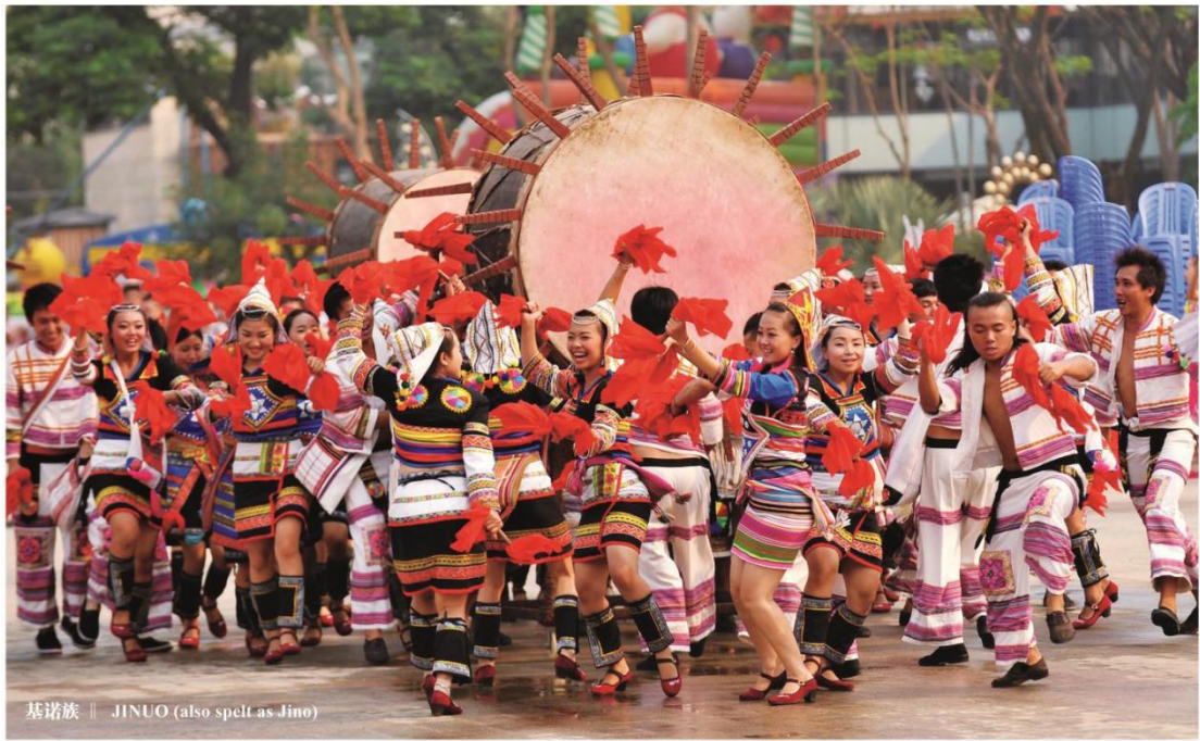
基诺族 || JINUO (also spelt as Jino)

基诺族主要聚居于云南省西双版纳傣族自治州，是云南省人口较少的7个特有民族之一。基诺族没有自己的文字，过去多以刻木、刻竹记数、记事。基诺族服饰简单古朴，喜欢穿自织的带有蓝、红、黑等彩条的土布衣服。