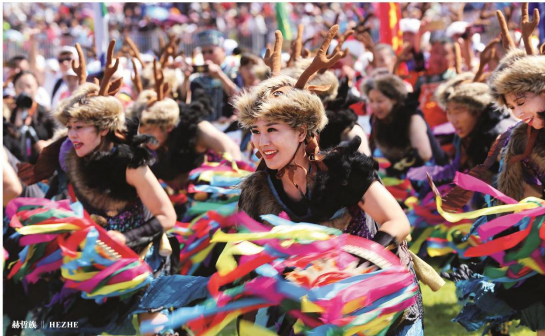
赫哲族 || HEZHE

中国境内的独龙族主要分布在云南省独龙江峡谷两岸、北部的怒江两岸等地，其生产活动主要为农业、采集和渔猎。独龙族的传统服装为一块五彩线织成的独龙毯，从左肩斜拉至胸前。独龙族男女均散发，少女有纹面的习惯。