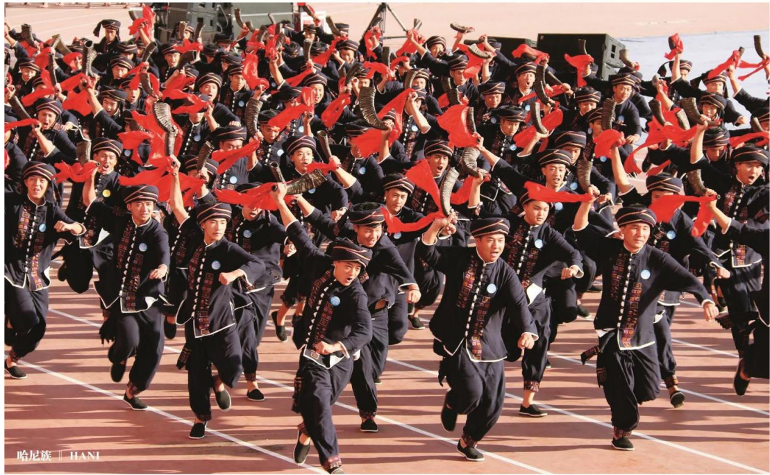
哈尼族 | HANI

哈尼族绝大部分集中分布于云南南部元江、澜沧江两江的中间地带，利用山区自然条件开垦梯田，是哈尼族的特长和千年传统，造就了赫赫有名的哈尼梯田景观。梯田凝结着哈尼族悠久漫长的历史，沉淀着丰厚广博的文化。哈尼族的服装一般用自己染织的土布做成，以蓝色和黑色为主，哈尼族男子一般着对襟上衣、宽松长裤、黑布包头，女子服装款式和装饰样式繁复。