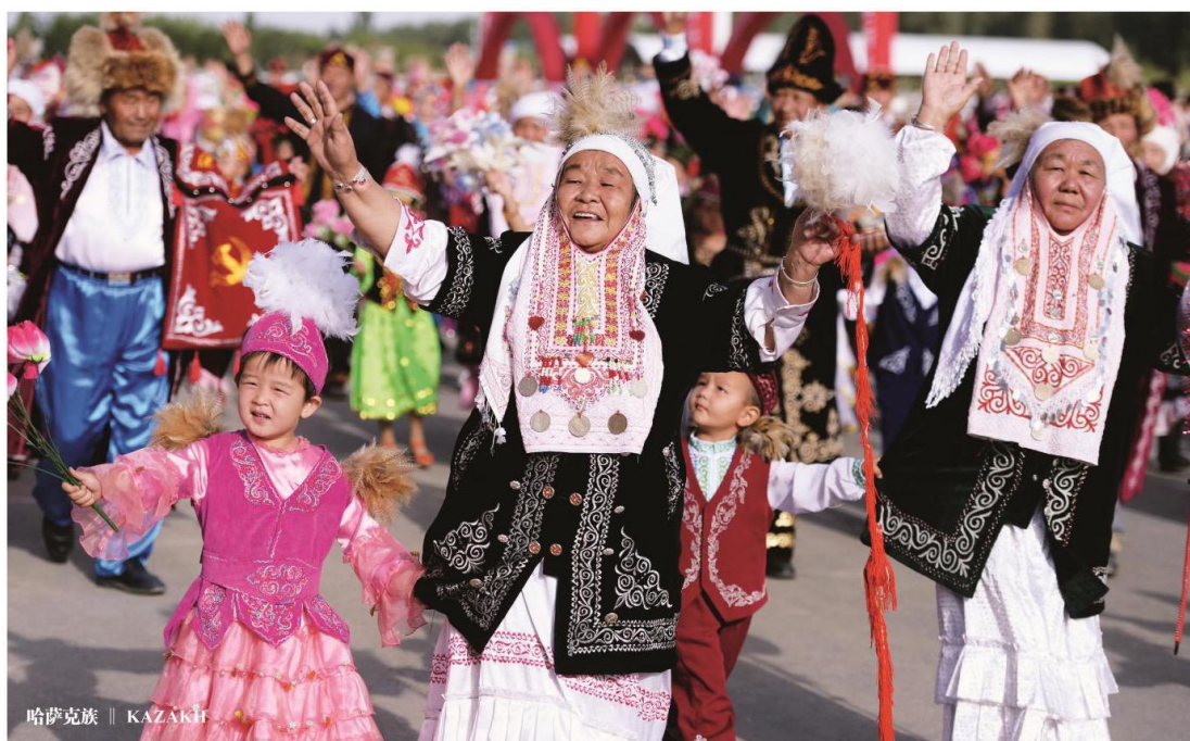
哈萨克族 || KAZAKH

水族主要分布于黔桂交界的龙江、都柳江上游地带。其历史悠久，依旧沿用着水族古文字体系“水书”，保留着图画文字、象形文字、抽象文字兼容的特色。水族的岁时节日丰富而奇特，皆与水族的历史、历法、农耕文化、原始信仰、居住分布等紧密相连。水族人的传统服饰自纺、自织、自染。自制的靛青染色是其服饰的主要特色。