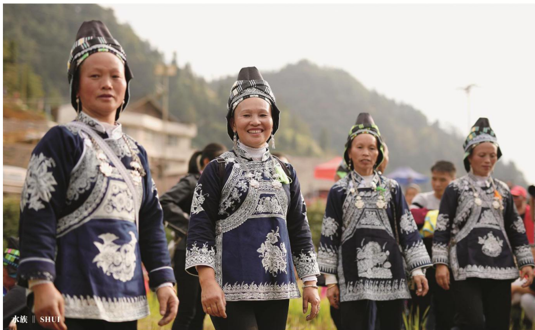
水族 || SHUI

白族主要分布在云南、贵州、湖南等省，其中以云南省的白族人口最多，主要聚居在云南省大理白族自治州。白族崇尚白色，以白色衣服为尊贵。白族传统信奉的宗教为本主崇拜，本主白语叫“武增”，是白族村社的保护神。白族节庆活动丰富，如三月街、本主节、蝴蝶会、剑川骡马会等，都非常具有地域及民族特色。