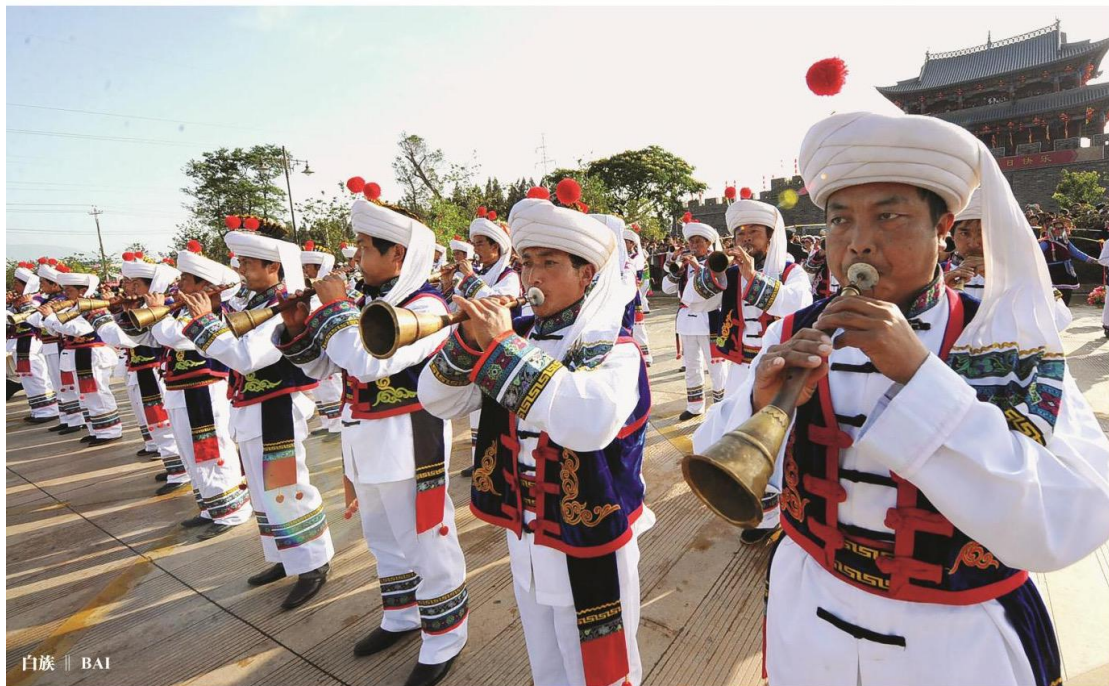
白族 | BAI

哈尼族绝大部分集中分布于云南南部元江、澜沧江两江的中间地带，利用山区自然条件开垦梯田，是哈尼族的特长和千年传统，造就了赫赫有名的哈尼梯田景观。梯田凝结着哈尼族悠久漫长的历史，沉淀着丰厚广博的文化。哈尼族的服装一般用自己染织的土布做成，以蓝色和黑色为主，哈尼族男子一般着对襟上衣、宽松长裤、黑布包头，女子服装款式和装饰样式繁复。