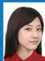
头部侧向一边 或未正视镜头