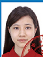
印章或其 他物遮挡人像