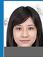
相片损坏 或有污痕