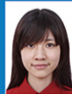
头发遮挡眉毛 眼睛或耳朵