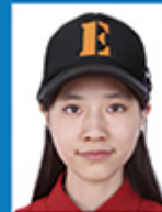
带帽、发饰 遮挡面部、耳朵