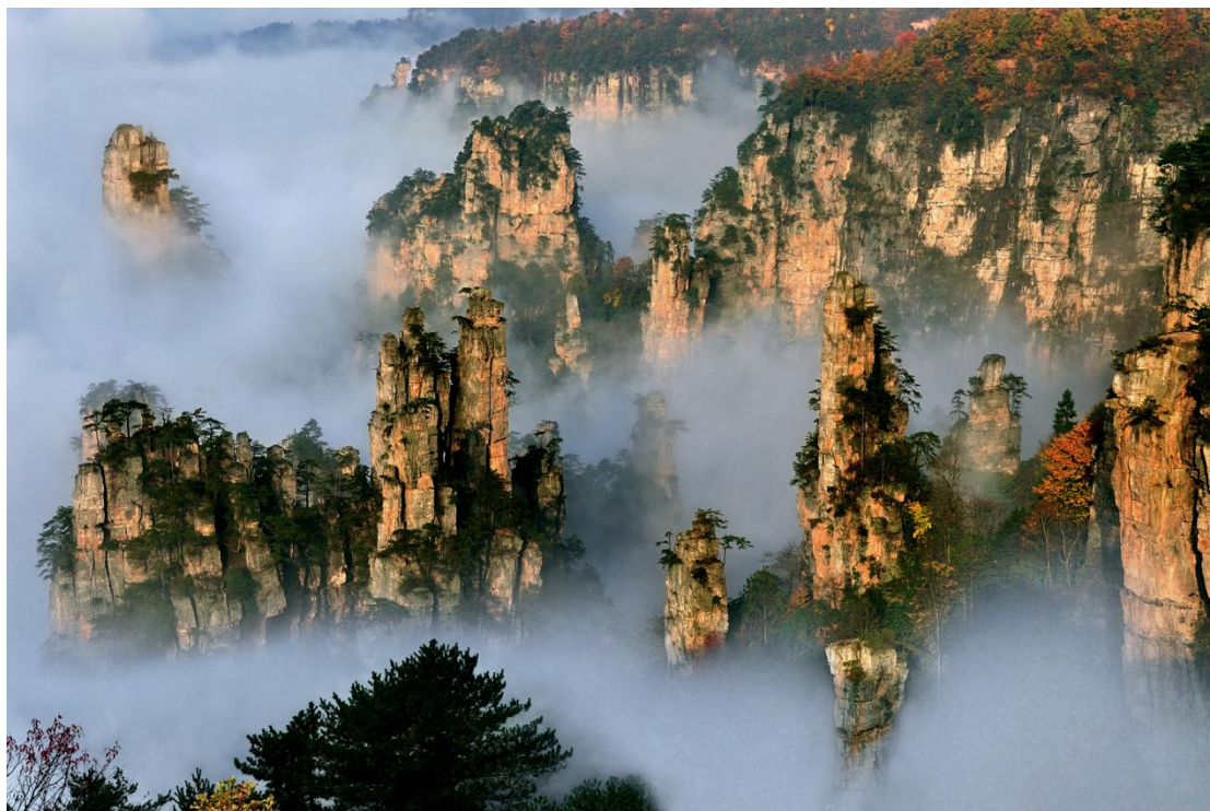
Pejzaž u Džangđijađijeu