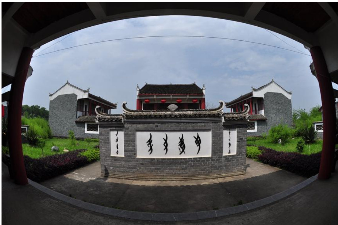
Okrug Đijangjung | Njušu (Žensko pismo)