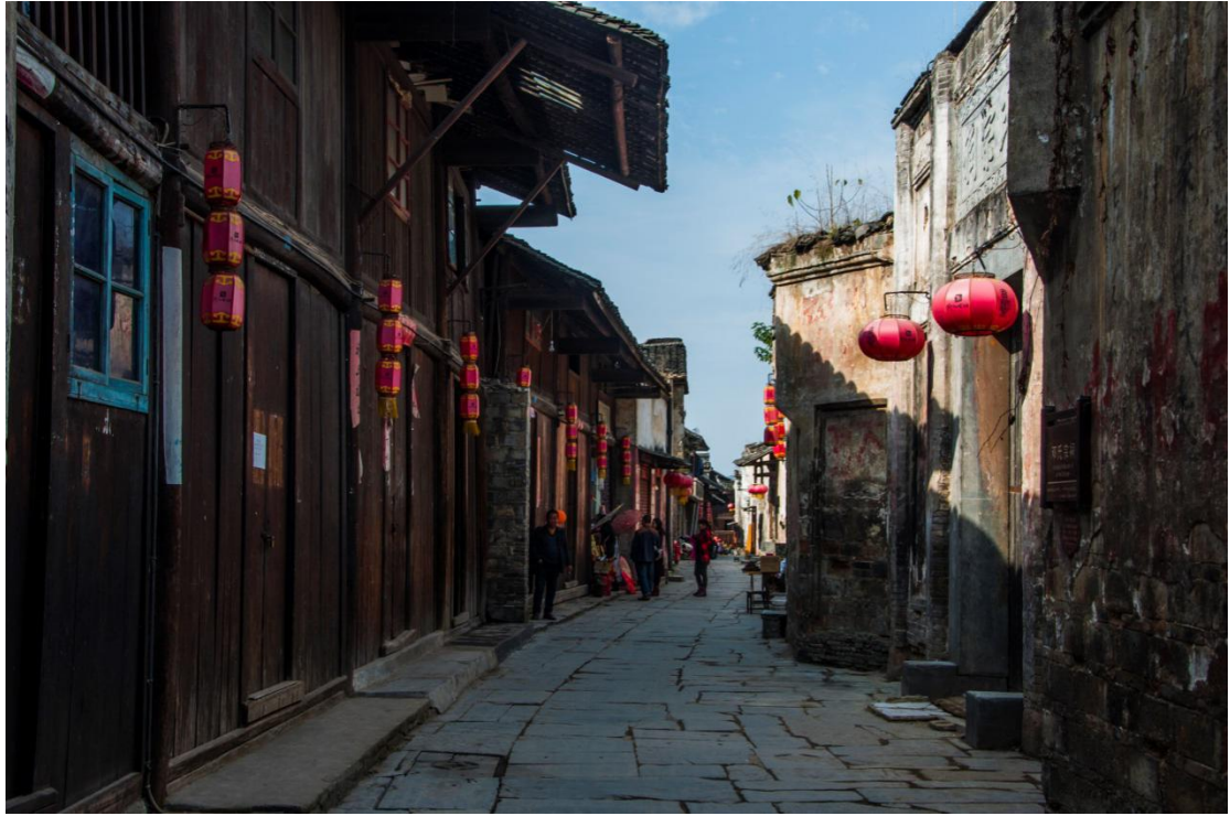
Huaihua | Antički grad Čijenjang