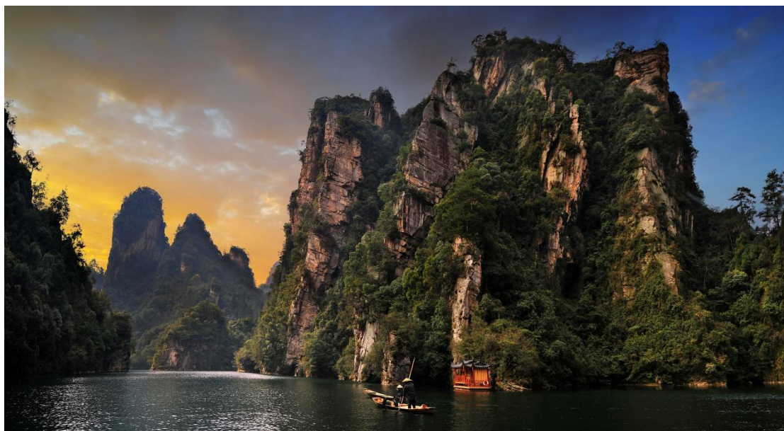
Džangđijađije | Jezero Baofeng