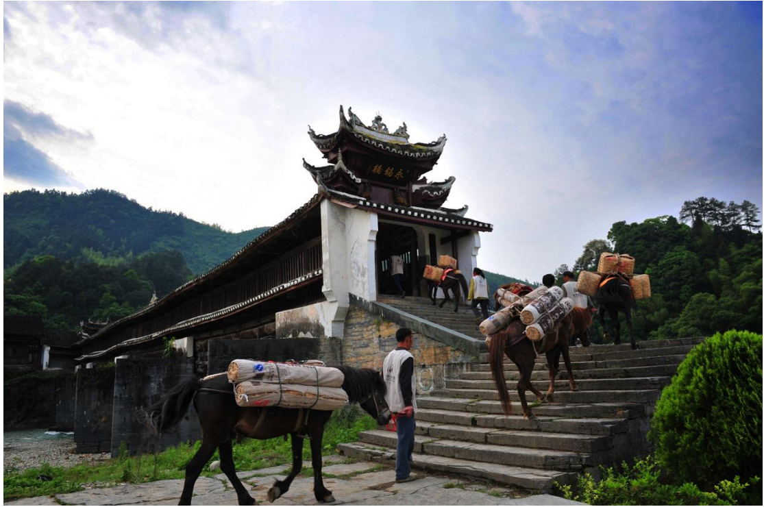
Jijang | Stari makadam za trgovinu čajem