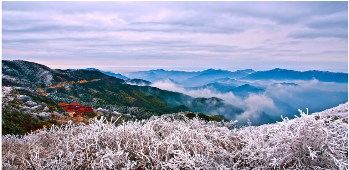
Planina Jangming pod snegom i ledom