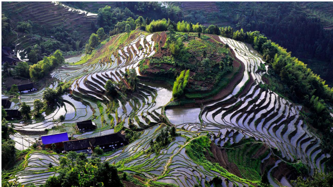
Loudi | Terasasta pirinčana polja