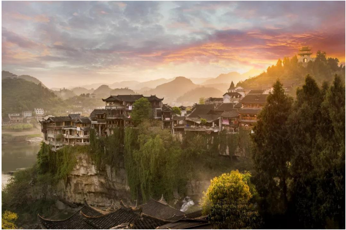
Antički grad Fenghuang (Feniks)