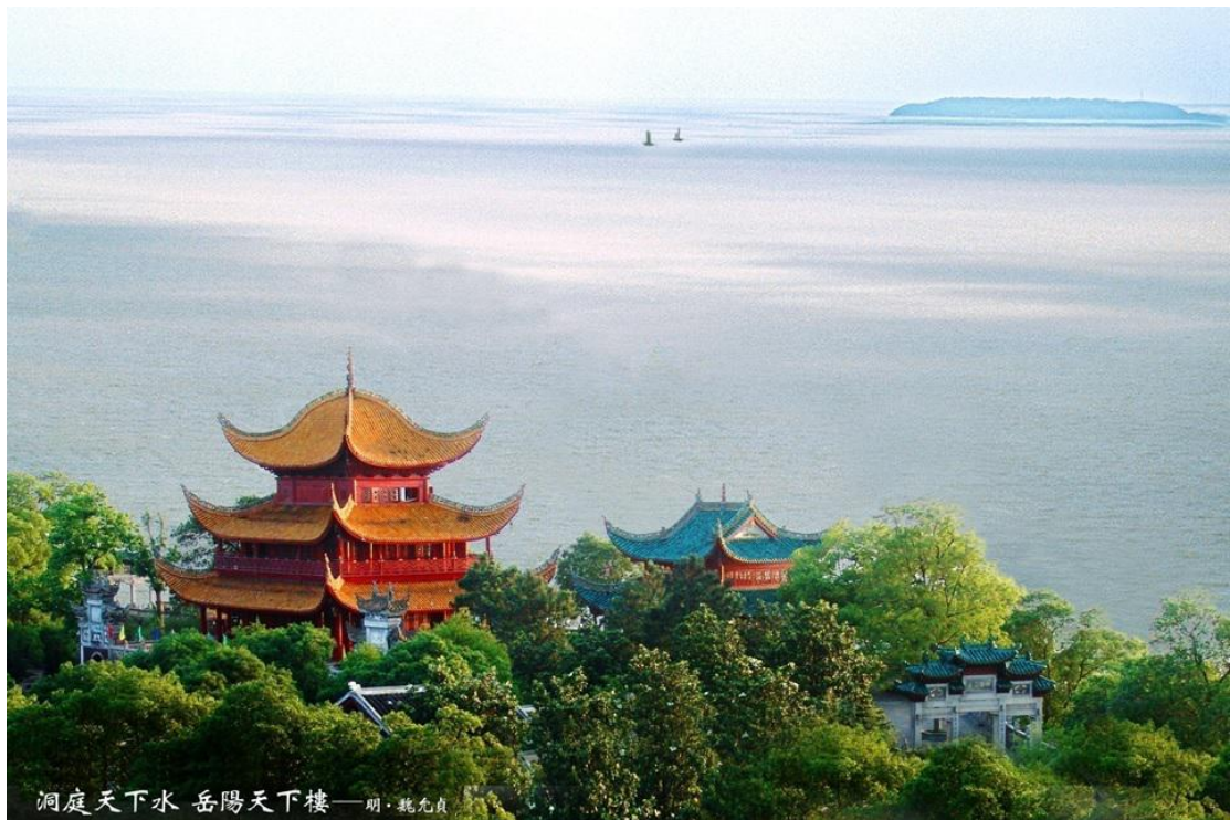
Kula u Juejangu