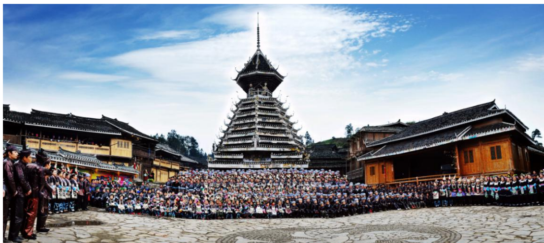
Nematerijalna kulturna baština | Pesma naroda Dung