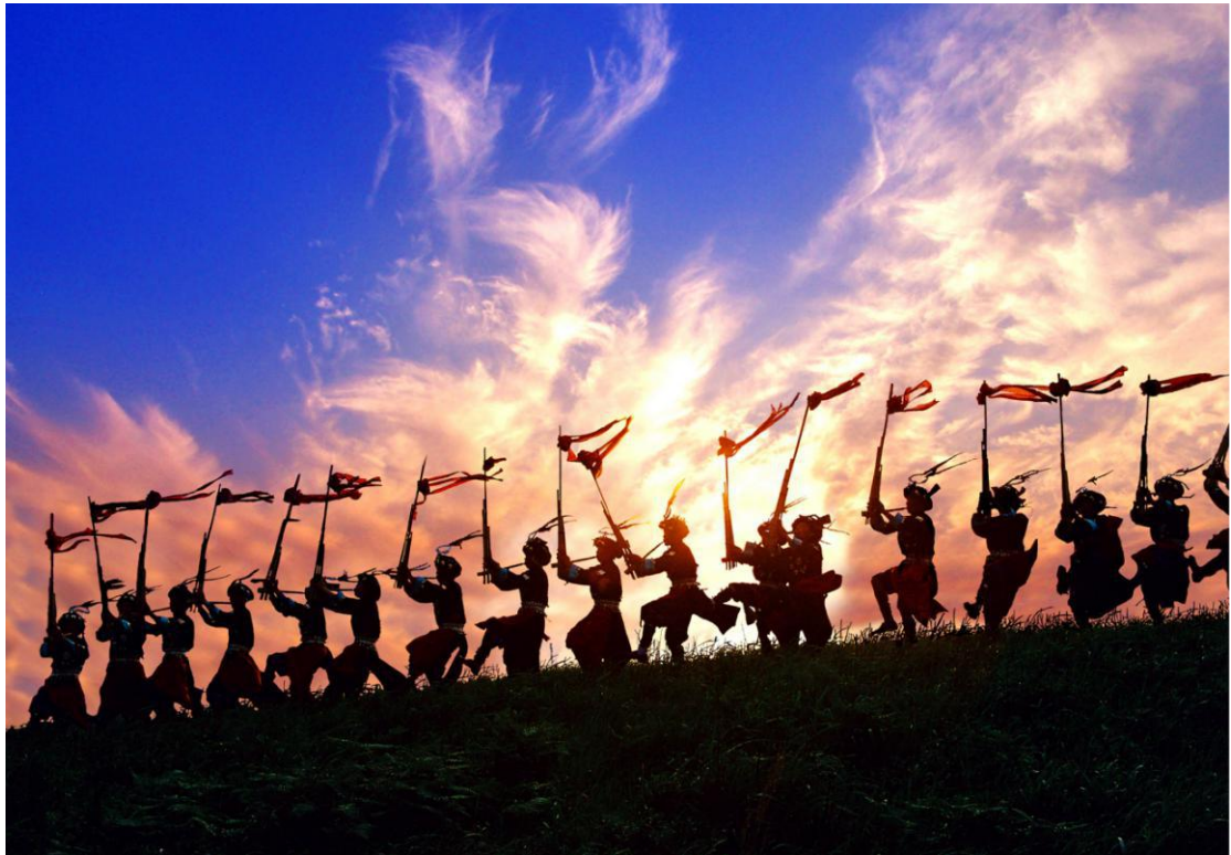
Ples sa sviralama naroda Mijao