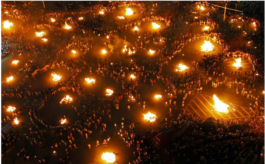
Festival baklji naroda Ji