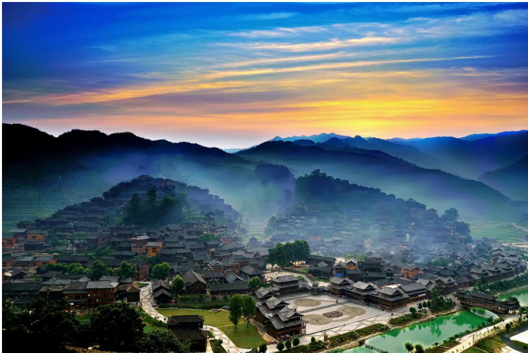
Sidijang | Ćijenu – selo naroda Mijao