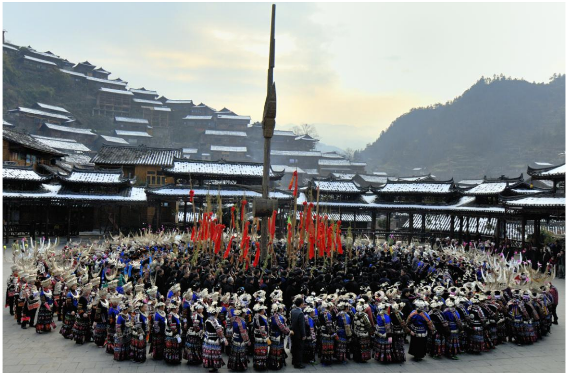
Nova godina naroda Mijao ( Mijao godina – Mijaonijen )