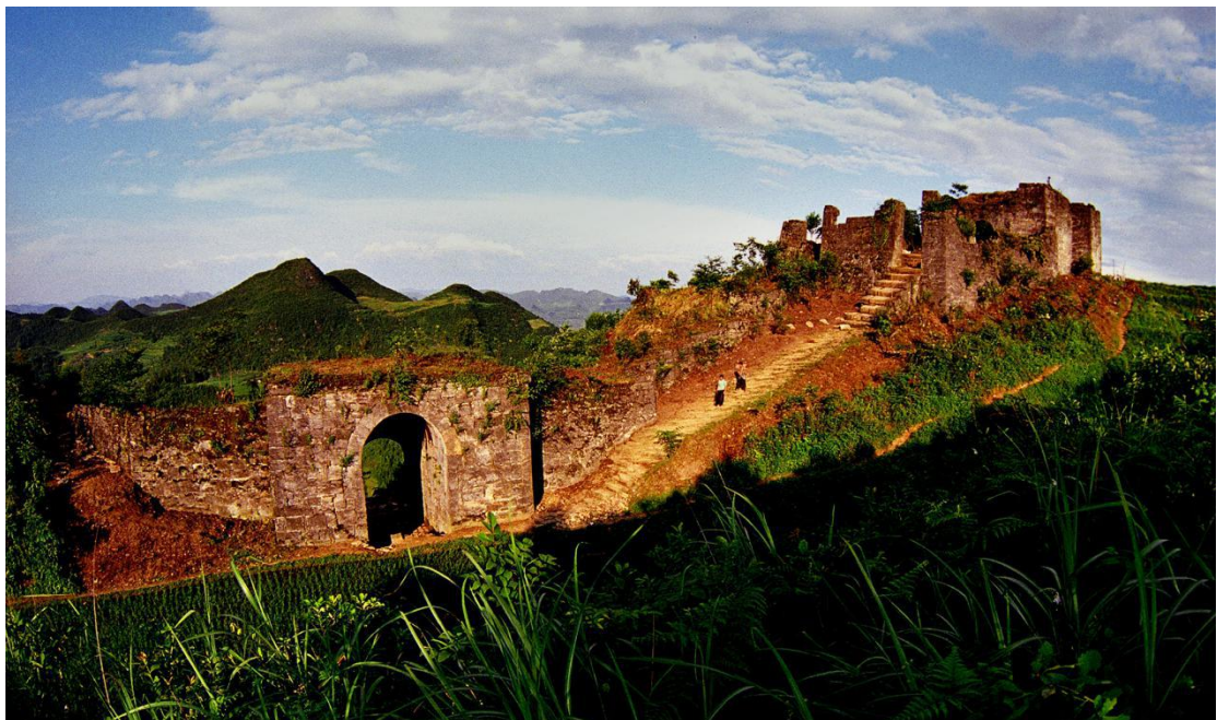
Svetska kulturna baština | Hailungtun