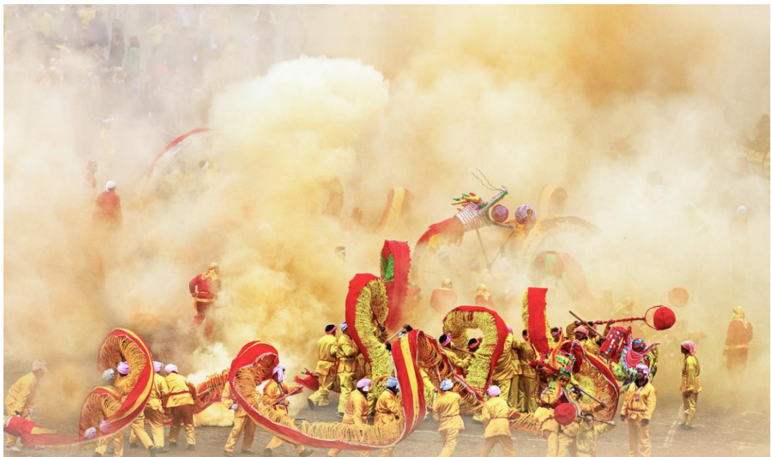
Festival zmajeva naroda Gelao