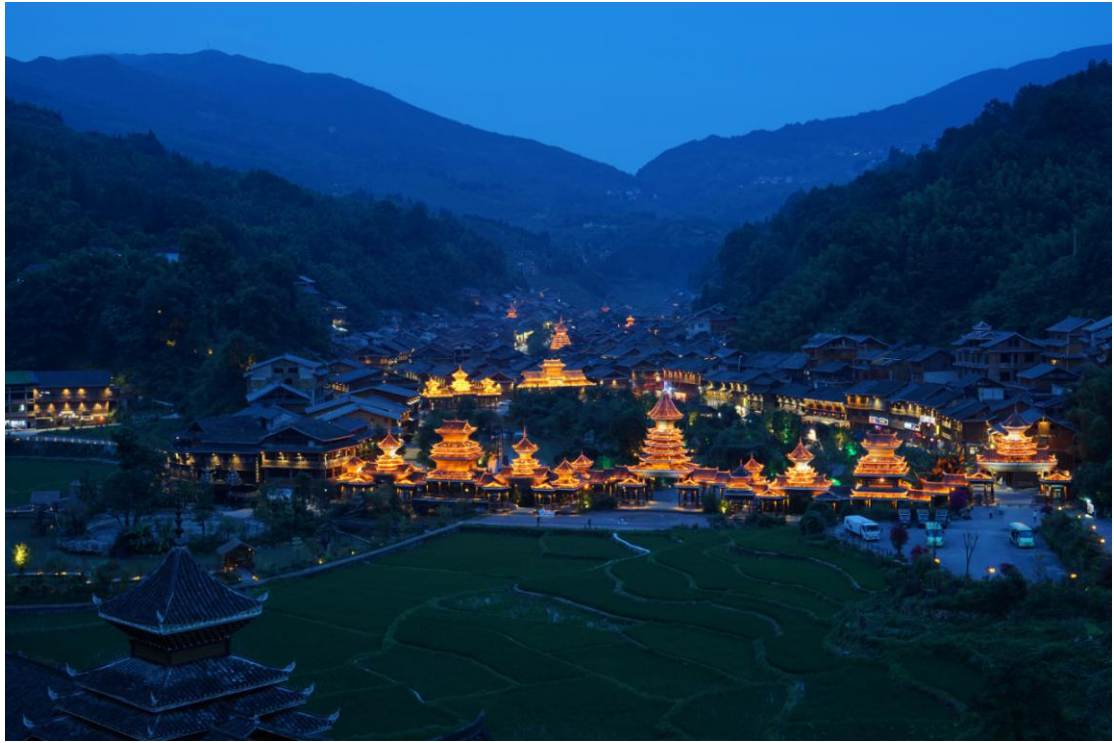
Džaosing | Selo naroda Dung