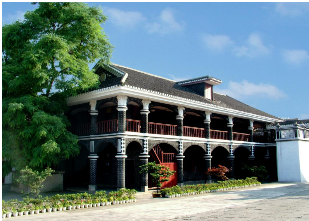
Cunji | Mesto sastajanja