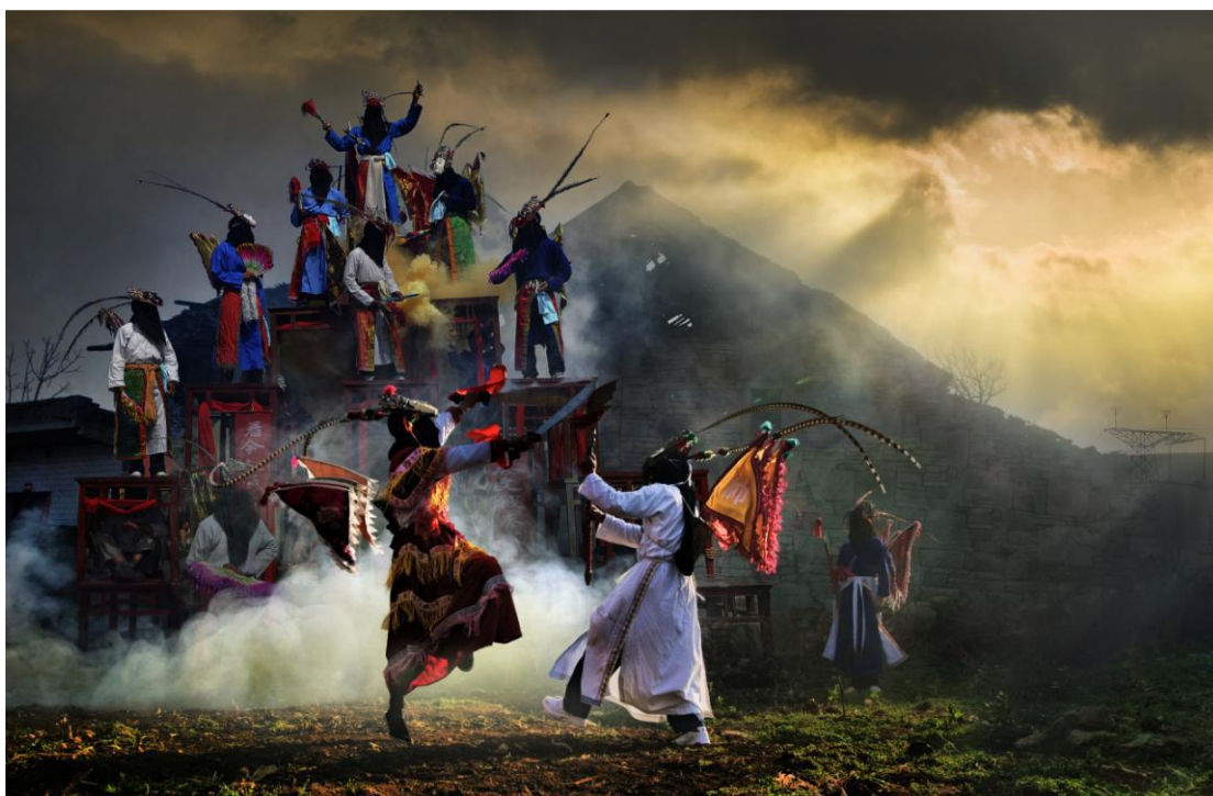
Anšun | Lokalna opera naroda Tunbao