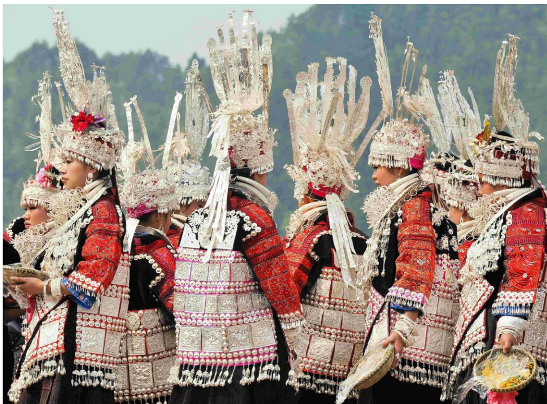
Festival sestara naroda Mijao