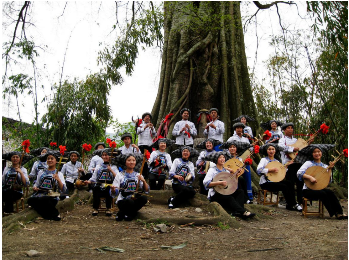
Pesma naroda Buji